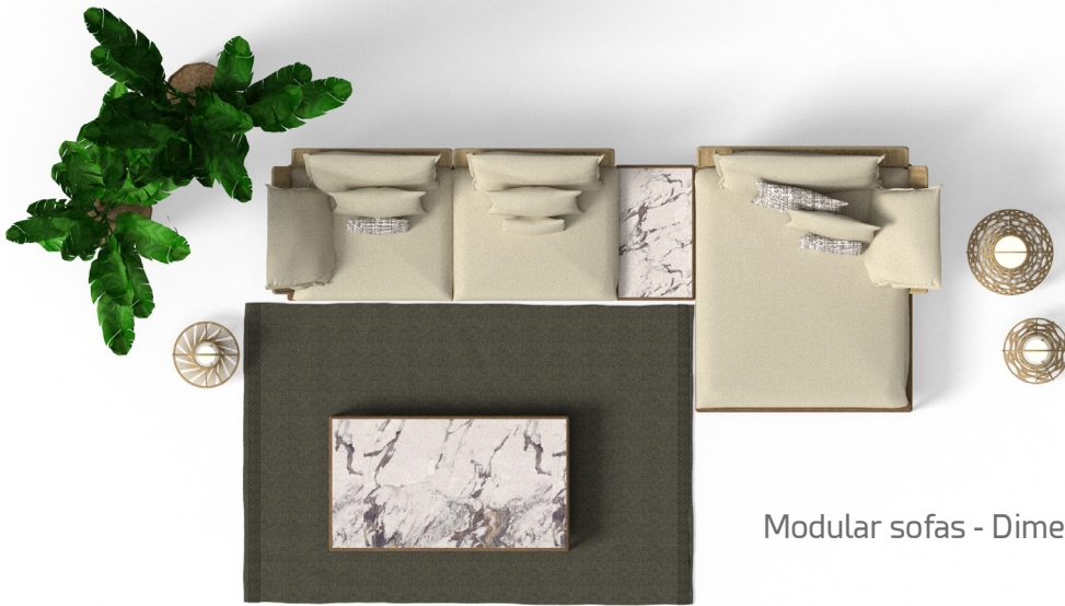
Modular sofas - Dimensions 430x175 cm